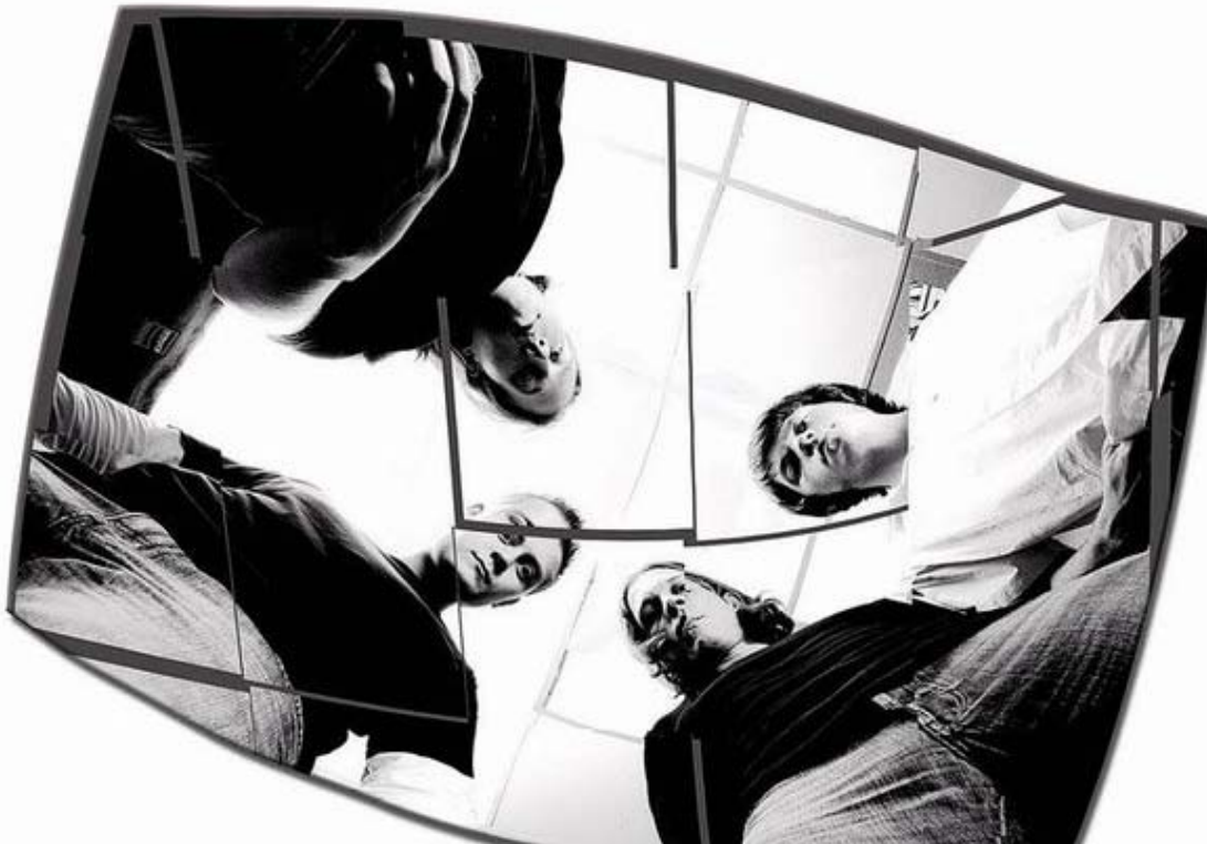
„Broken Glass“: Die Band aus Freiburg ist überregional bekannt.

Morgen Abend sorgen die Bands "Anyway" und "Broken Glass für Stimmung in Elzach.